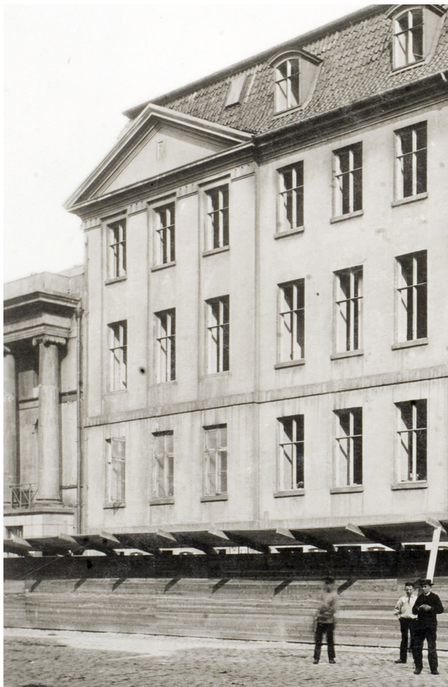
Almindelig Hospital var hovedstadens fattigsygehus, og her fungerede Brandes som overlæge fra 1863. Fotografiet er taget i 1846, hvor Brandes var kandidat på hospitalet.