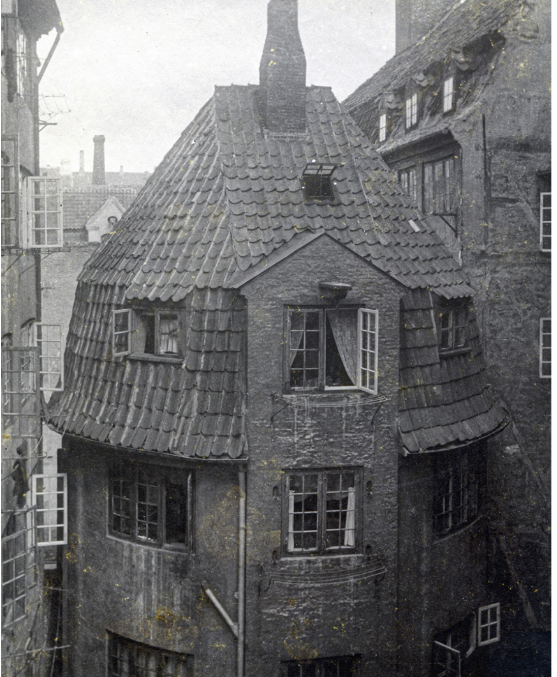
Københavns vækst op igennem 1800-tallet betød, at især den voksende arbejderklasse boede trangt og tæt. Fotografiet er fra en baggård i Adelgade i 1898.