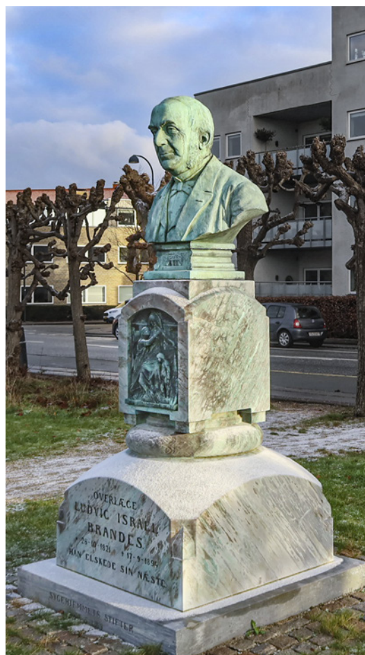
Buste af Ludvig Israel Brandes ved Holmegårdsparken (tidligere Københavns og Omegns Sygehjem) nord for København.

»Min Moder var mere alvorlig, fra Ungdommen af var hun svagelig og ofte meget lidende men klagede kun sjældent og søgte at skjule sine Lidelser