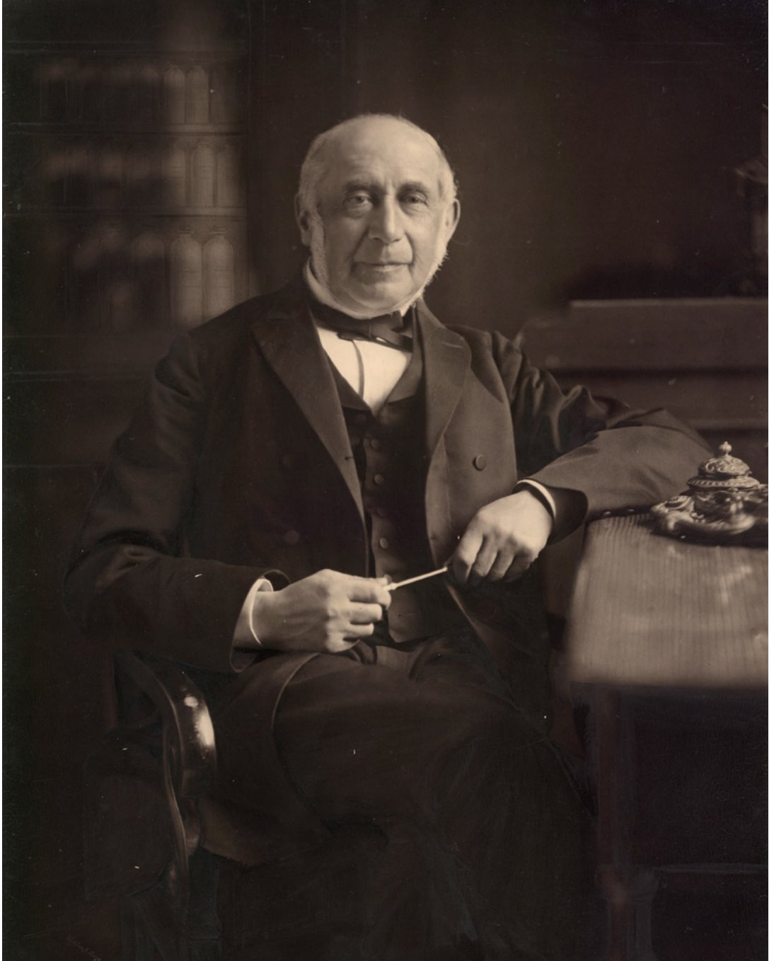
Udateret portrætfotografi af Ludvig Israel Brandes (Det Kgl. Bibliotek).